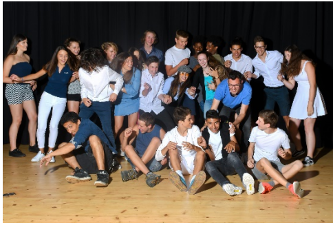
3. ORS Abschlussklasse 2017/18