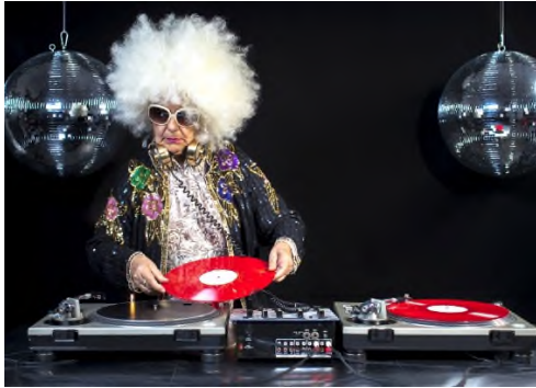
Musikunterricht für Erwachsene

Dann sind sie bei uns an der Musikschule Hergiswil goldrichtig! Wir bieten Musikunterricht für Erwachsene und Senioren.