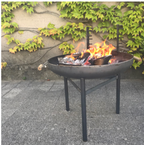
Gut Glut will Weile haben