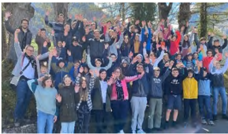
Probeweekend HSO 1 & 2 im April 22

www.schule-hergiswil.ch/angeboteschule/6076