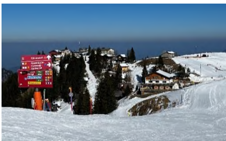
Schönste Bedingungen im März

Herzliche Gratulation allen Teilnehmenden und ganz speziell allen Preisträgerinnen und Preisträgern.