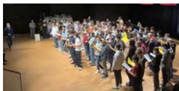
Hergiswiler ORS Schülerinnen und Schüler

Über 4000 Spucktests wurden von August 21 bis März 22 an der Schule Hergiswil abgegeben. 150 Zertifikate wurden ausgestellt; total haben sich über 700 Personen auf unserem Tool angemeldet. Wir könnten Ihnen noch viele spannende und weniger spannende Zahlen präsentieren. Vor allem aber möchten wir Ihnen danken. Nur gemeinsam haben wir es geschafft, diese schwierige Zeit zu meistern.