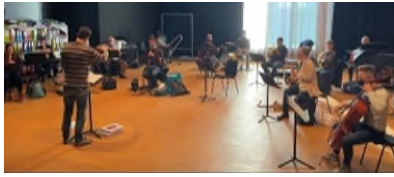
Die Profis am Musizieren