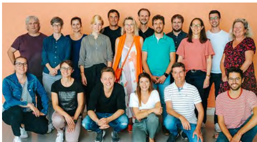
Team Haus der Musik

Im nächsten Schuljahr fahren wir darum mit dem Angebot um die Hälfte zurück: Jeweils in der ersten Ferienwoche betreuen wir gerne Ihr Kind. Danke, dass Sie sich frühzeitig einen Platz sichern.