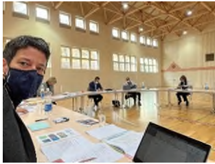
Klausur im Loppersaal

Am 11. Januar haben sich die Musiklehrpersonen zu einer Weiterbildung getroffen. Erstmals haben sich unsere Berufsmusiker zu einem Ensemble zusammengeschlossen. Toll hat es getönt!