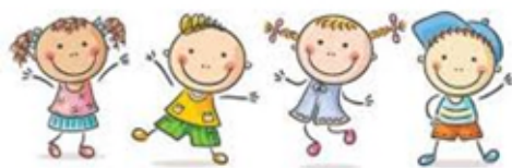
Fröhliches Singen und Eintauchen in die Welt der Musik mit einfachen Liedern und Bewegungen