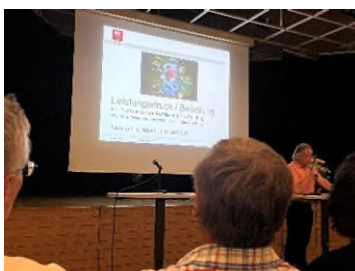
Spannende Inputs und Diskussionen in Stans