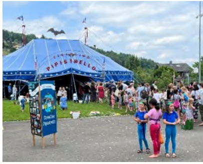
Grosser Andrang ins Zirkuszelt