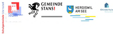
Zusammenarbeit von Stansstad, Stans und Hergiswil

Mitte Mai war beim Schulhaus Matt der Circolino Pipistrello zu Gast. Alle Schülerinnen und Schüler vom Kindergarten bis zur sechsten Klasse durften in verschiedensten Ateliers Zirkusluft schnuppern. Der grosse Höhepunkt war das Zirkusfest am 21. Mai. Der Schlusspunkt bildete die Aufführung im Zirkuszelt. Herzerwärmend, berührend, einmalig – war das ein tolles Projekt!