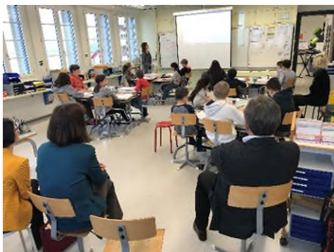
Schulbesuchstag vor drei Jahren

Am Freitag, dem 3. Juni 2022 findet der letzte Elternbesuchstag im laufenden Schuljahr statt.