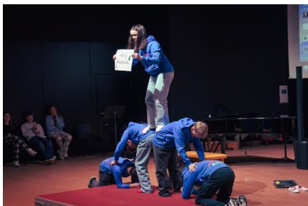
Akrobatische Schülerinnen und Schüler