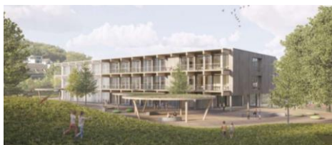
Schulraum Matt ist in Planung

Aufgrund steigender Schülerzahlen ist die Gemeinde am Planen von neuem Schulraum.