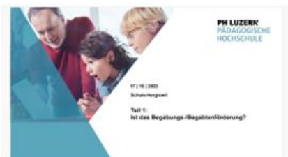
Was genau ist BBF?

Wir wünschen Ihnen gute Unterhaltung beim Lesen unseres Newsletters.