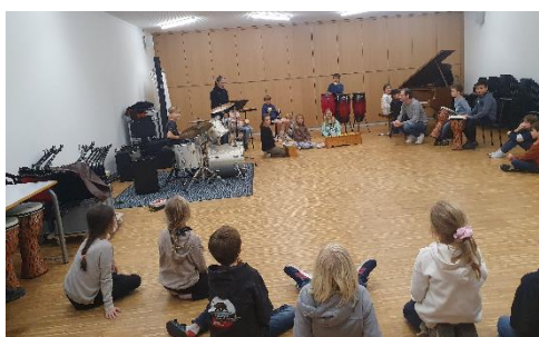
Nicht nur in der Grobi, sondern auch im Musiksaal fand die Erzählnacht statt.