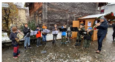
Brass-Family am Adventsmarkt

Auch klamme Finger und heftiges Schneetreiben steckten die neun jungen Blechbläser der Musikschule Hergiswil locker weg.