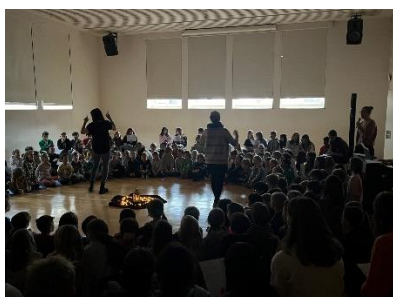
Weihnächtliche Klänge im Dorf

Singen bewegt das Herz von Klein bis Gross.