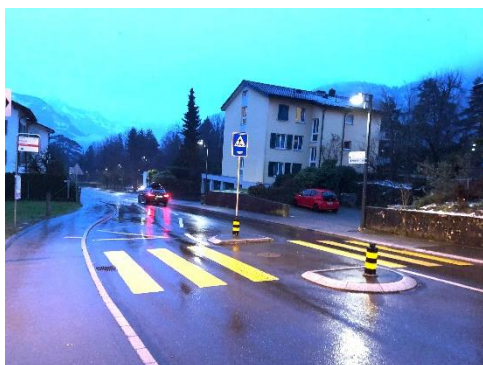
Seien Sie ein gutes Vorbild und benützen Sie den Fussgängerstreifen.

Die detaillierten Daten von Schulferien und schulfreien Tagen finden Sie in der Ferienordnung auf der Website der Schule Hergiswil.