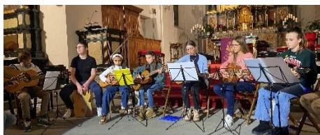
Weihnachtszauber in der Kirche

Freudig, aufgeregt und feierlich musizierten 80 Kinder und Jugendliche der Musikschule Hergiswil in der voll besetzten katholischen Kirche.